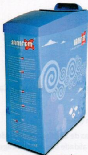
Fig. 2: Caixotes do lixo para resíduos