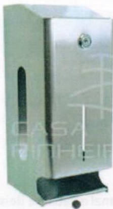
Fig. 1: Dispensadores de pensos higiénicos

Os critérios para aquisição/compra dos dispensadores terão em conta os materiais de fabrico, visando não só a durabilidade necessária em ambiente escolar, como a conformidade com princípios elementares de sustentabilidade e preservação do meio ambiente.